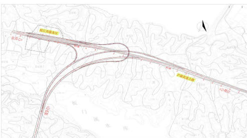
图4 方案二平面布置图

方案二：保留枝江西服务区，采用左转弯匝道迂回型T型互通。其中，重庆往宜昌方向匝道采用迂回型匝道，在进入枝江西服务区前并入枝江西服务区匝道，经服务区后，进入沪渝高速公路；宜昌往重庆方向匝道经服务区后，与服务区匝道分离，接本项目武汉往重庆方向匝道。该方案工程造价较低，但宜昌往返重庆方向交通量与沪渝高速进出服务区交通流有一定程度的干扰，尤其是宜昌往重庆方向交通量在经过服务区后加速行驶的同时进行分流，安全隐患较大。