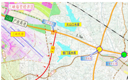
图 1 项目起点方案图

根据路线总体走向, 本项目高速公路起点在枝江市安福寺镇板门溪村设置“T”型互通接沪渝高速。为绕避宜昌三峡机场规划范围, 尽量从板门溪水库边缘通过, 同时满足与枝江西枢纽互通净距要求, 经充分论证后起点拟设置在枝江西服务区东侧, 具体位置如图 1 所示。