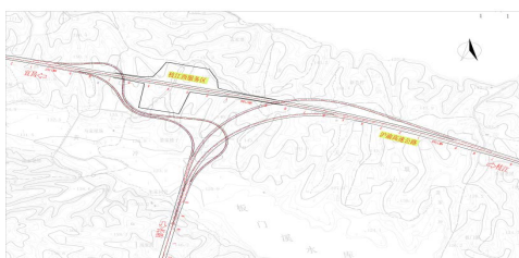
图5 方案三平面布置图

方案三：保留枝江西服务区，左转弯匝道从服务区南侧绕避枝江西服务区，满足该方向匝道在主线侧分、合流鼻与服务区匝道在主线侧分、合流鼻净距的要求。该方案避免了与进出服务区交通量的干扰，也无需迁建枝江西服务区。主线侧连续连续分、合流鼻端之间的距离大于350m，满足规范要求。因而，从交通组织、工程投资费用等方面综合考虑，本互通采用该方案。