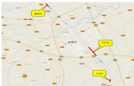
图1 项目地理位置图

本次养护工程是省港航事业发展中心(原省航道局)2018年下达我中心的航道养护改善工程项目, 工程在盐城市区段盐徐高速跨通榆河大桥上游 1.3km 段落采用金属丝网箱结构。