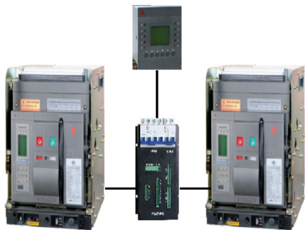
图2 CA1W配合CW3的双电源互投装置结构

该自动转换开关电器为 CB 级，由自动转换控制器、转换器、控制电缆和智能型框架断路器四部分组成，可选机械连锁配合使用。额定工作电流 200A-6300A。具有两路电源转换转换解决方案，具有手动、自投自复、自投不自复（互为备用）、强制等转换模式，并提供强制并联转换功能，满足负载侧不间断供电的要求，控制器集成度高。过电压类别分为 IV 类，冲击耐受电压为 12kV，额定短路分断 / 额定短路接通最大达 100kA/220kV，满足大容量变压器电源断需求。