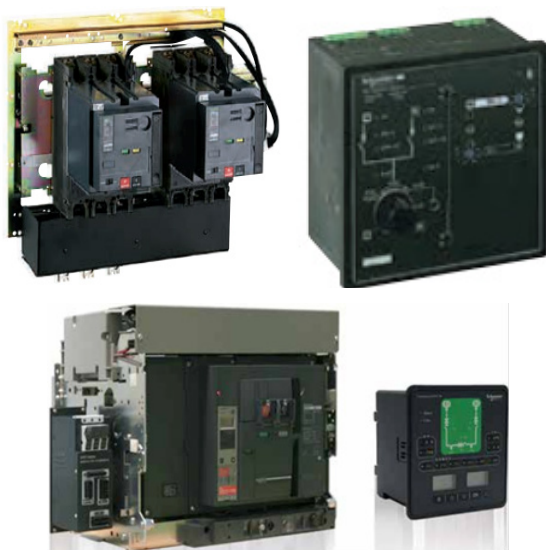
图5 ATMT800H4P2A 产品 安装方式为适配器与断路器一同安装,通过二次线