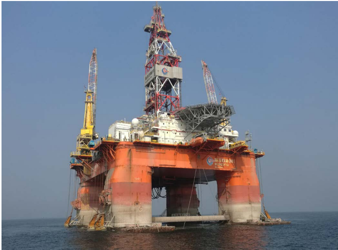
图 1 到达烟台港时的“海洋石油 981”平台

随着世界上石油钻井平台数量的增多, 钻井平台出现故障也在增多。为使钻井平台持久正常的工作, 保障钻井平台和海洋环境的安全, 需要定期进船坞进行维修和保养。近几年来, 烟台中集莱福士船厂为世界上多家石油公司钻井平台进行了维修和保养, “海洋石油 981”钻井平台就是其中之一(图 1), 烟台港引航站负责承担该钻井平台进出船坞的引航任务。