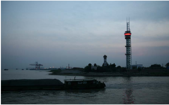
图1 灯器升级后的1号航标

航标灯光源采用普通LED管,灯质采用红色莫尔斯“H”,4闪红光,周期8秒,灯塔的日间视距可达10km以上,灯光有效射程大于10km。工程投入使用以来,助航效果明显,工程水域通航条件得到明显改善,船员反应良好。